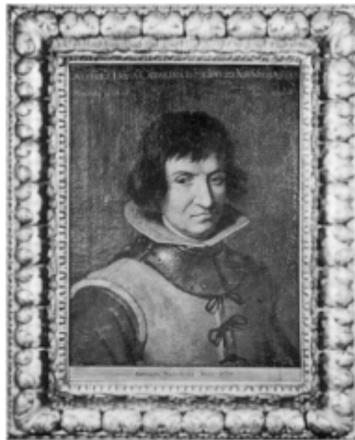
El alférez doña Catalina de Erauso, obra de Francisco Pacheco (1564-1644)

Quin paper juga en aquest esquema l'orientació del desig, l'orientació sexual?