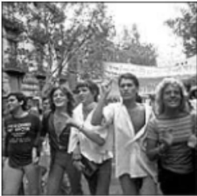
La primera manifestació de l'Orgull Gai, convocada pel FAGC el juny de 1977.

Els apartats 1 i 2 parlen de la legislació del moment. Com han evolucionat les lleis des d'aleshores? En quin moment van ser amnistiats els empresonats per causa de la Llei de Perillositat Social? Hi ha legislació contra l'homofòbia a Espanya? Quan es va aprovar?