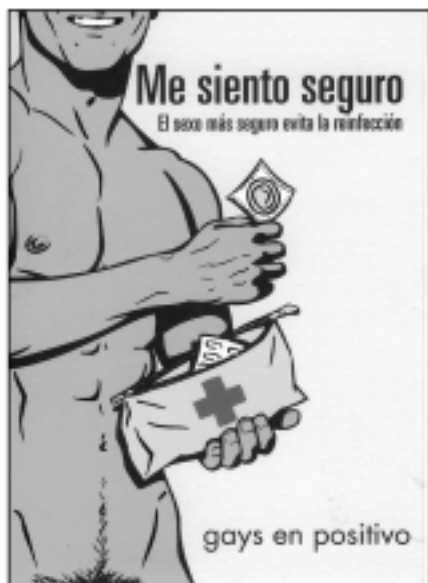
Campanya de Gais Positius a favor del sexe + segur

Com es transmet la SIDA? Creus que es pot parlar de «grups de risc», com s'ha fet fins no fa gaire, o s'ha de parlar de «pràctiques de risc»?